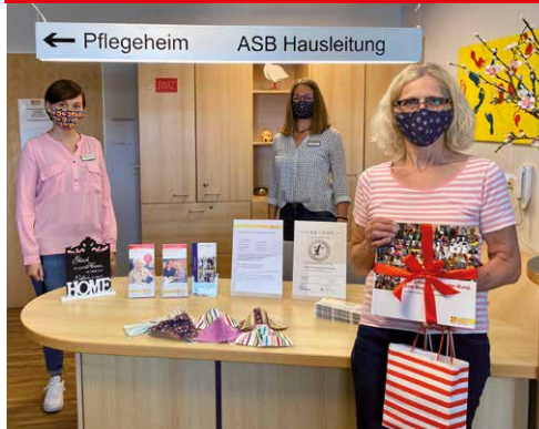
Überall wurde fleißig genäht und Masken für den Alltag an Mitarbeiter und Angehörige verschenkt