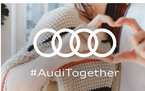
Von der AUDI AG erhielt der ASB Region Heilbronn-Franken eine großzügige Soforthilfe

Arbeiter-Samariter-Bund Baden-Württemberg e.V. Region Heilbronn-Franken