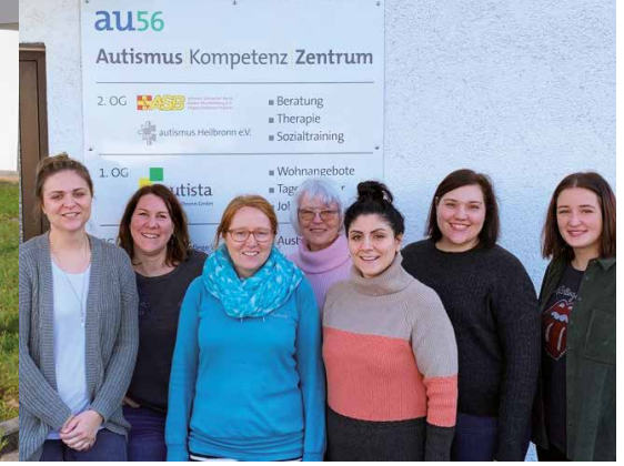
Das Team der au56 im Januar 2020