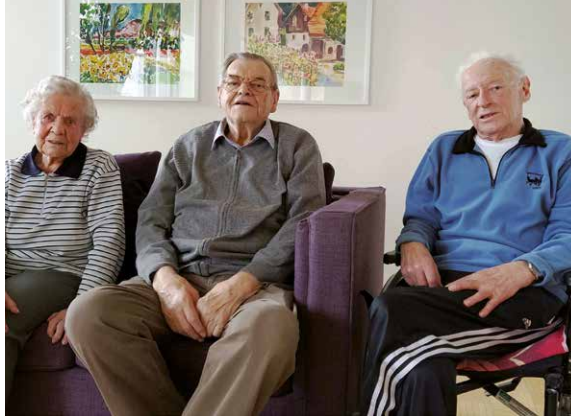
Zeitzeugen im ASB Pflegezentrum