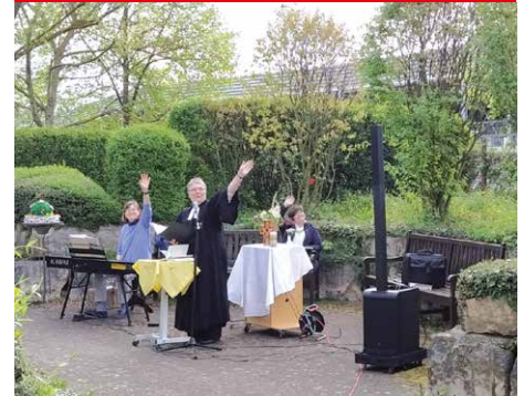
Open Air Gottesdienst im Garten

Impressum: Arbeiter-Samariter-Bund Baden-Württemberg e.V., Region Heilbronn-Franken, Ferdinand-Braun-Str. 19, 74074 Heilbronn Telefon: 07131/97 39 - 0; Fax: 07131/97 39 390 info@asb-heilbronn.de, www.asb-heilbronn.de Redaktion: Harald Friese, Rainer Holthuis, Izabela Beeken, Katharina Faude, Silke Hengst Verantwortlich für den Inhalt i.S.d.P.: Rainer Holthuis Entwurf, Satz und grafische Gestaltung: stachederundsander, Ulm · www.stachederundsander.de Druck: Illig Druck & Medienwerkstatt GmbH, Flein