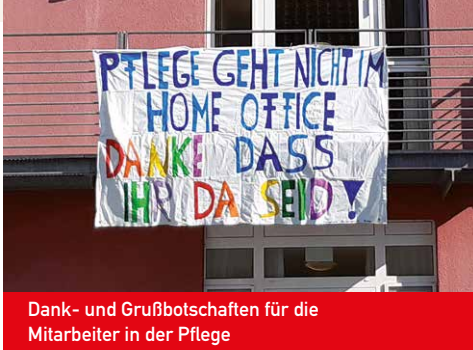
Dank- und Grußbotschaften für die Mitarbeiter in der Pflege