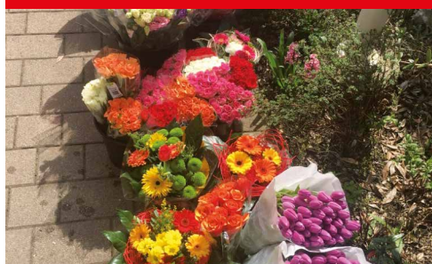
Das Blumen-Outlet Sinsheim schickte mehrfach Blumen an die ASB-Einrichtungen