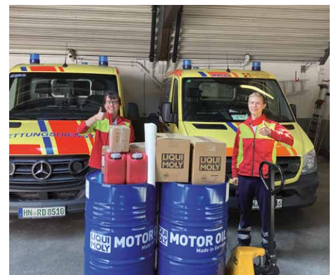
Liqui Moly unterstützte den Fuhrpark mit Ölen und Additiven